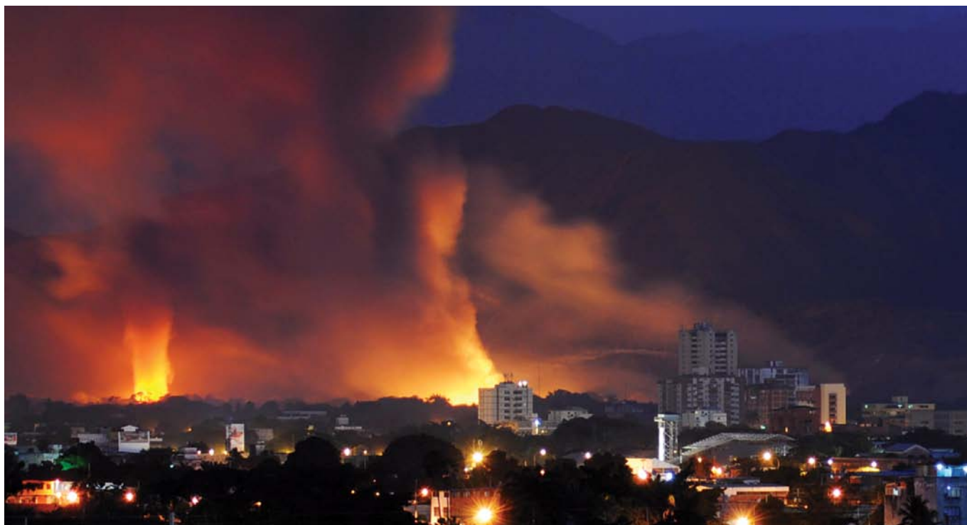
Një zjarr u raportua si shkak i një shpërthimi të një depoje municioni artilerie të ushtrisë venezuelase, duke vrarë një person dhe duke detyruar evakuimin e 10 000 banorëve nga zonat përreth. Marakaj, Venezuelë. Janar 2011.

terale dhe përmes organizatave rajonale kanë asistuar me dhjetëra qeveri në asgjësimin e sigurt të stoqeve të tepërta të municioneve dhe në sigurimin e materialeve të mbetura në kushte të sigurta. 10